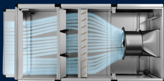
ZerAx ® MET PM \approx 85%