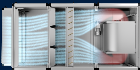
CENTRIFUGAAL MET DC \approx 63%

LUCHTSTROMING EN TOTAAL RENDEMENTEN BIJ VERSCHILLENDE MOTOR-VENTILATOR OPSTELLINGEN