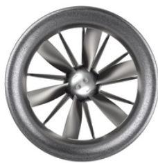
ZerAx ® VENTILATOR